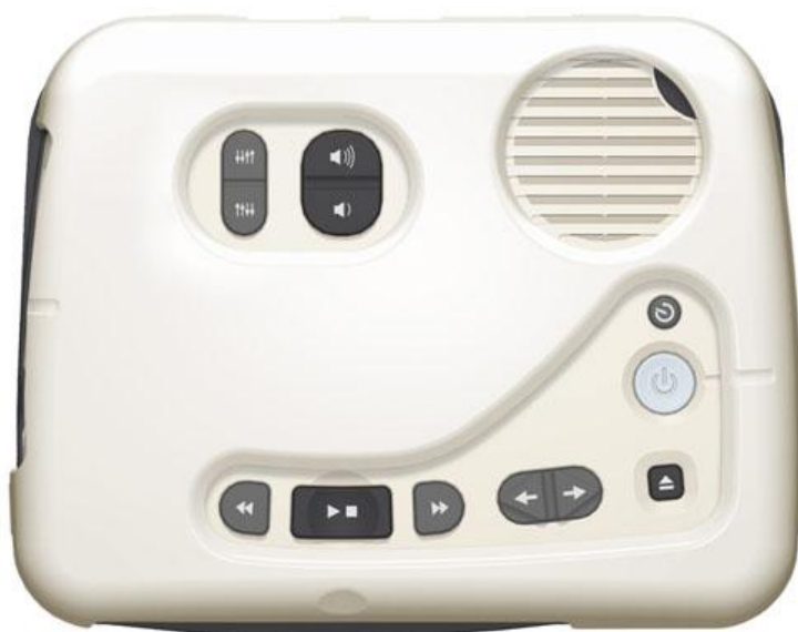
PTN-2 med överlägget monterat

Vi leverans följer, förutom själva spelaren, tangentbordsöverlägget och denna instruktion, följande med: