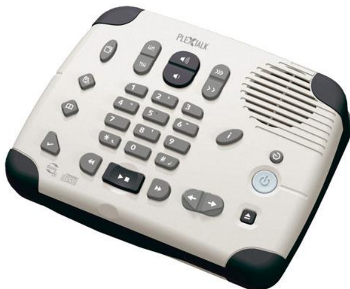
PTN-2 med borttaget överlägg

Vid leverans sitter ett överlägg av plast på spelaren. Det täcker en del tangenter. Spelaren kan användas med överlägget på men får då lite begränsade funktioner.